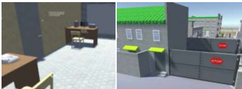
Рисунок 2. Практические ситуации в трехмерной среде

3. Трёхмерное моделирование практической ситуации, которую необходимо выполнить курсанту для формирования компетенций. С помощью трёхмерной анимации и написания программного кода появляется возможность имитировать ситуацию оперативно-служебной деятельности, которую необходимо выполнить курсанту для получения и закрепления навыков уверенной работы с объектом (рис. 2).